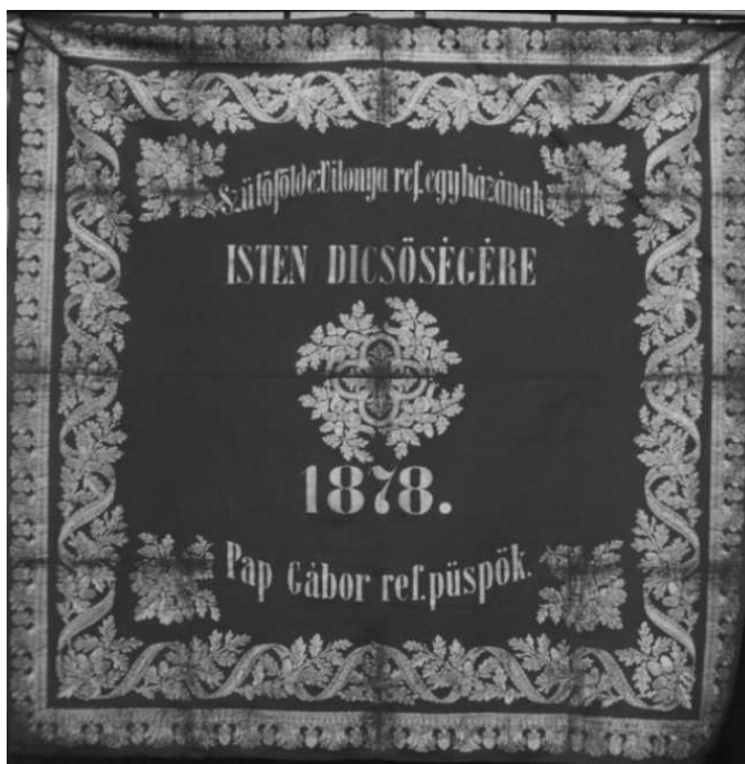
4. kép: PAP GÁBOR PÜSPÖK AJÁNDÉKA SZÜLŐFALUJÁNAK

Nyomtatásba való megjelenését Vilonya Önkormányzata segítette.